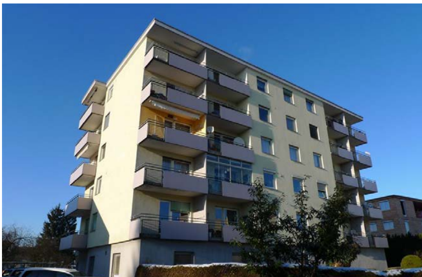
Foto: Edificio de viviendas en Bahnhofstr. 43, 6890 Lustenau con SATE de EPS (año de construcción 1966)

Con una adecuada instalación, los sistemas de aislamiento térmico por el exterior (SATE) han demostrado tener una duración de muchas décadas. De un tiempo a esta parte, en algunos países la colocación de un SATE sobre otro se está utilizando para alcanzar el estado del arte óptimo en lo referente al aislamiento térmico.