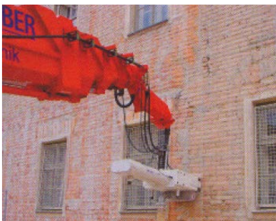
Foto: Fresa en funcionamiento