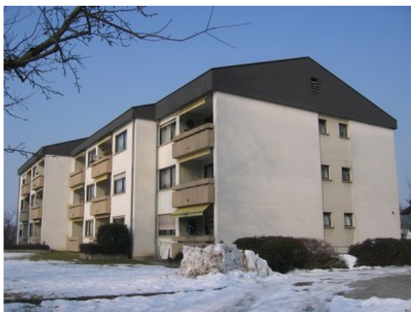
Imagen: Edificio de viviendas Rankweil-Schleipfweg antes de la rehabilitación