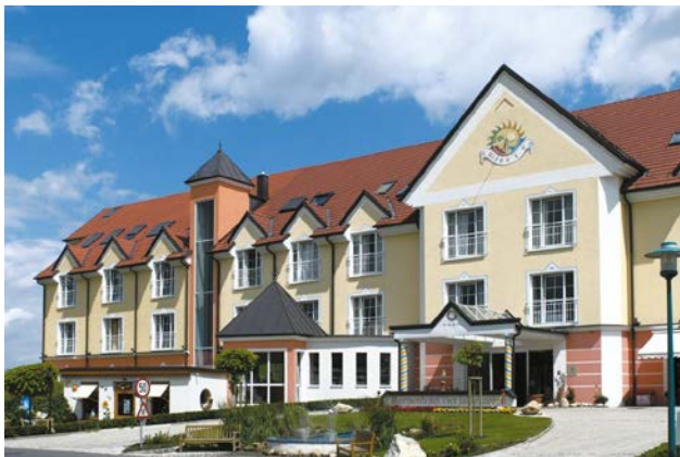
Imagen: Spa hotel Lutzmannsburg

Desde el punto de vista estético, existen edificios más o menos atractivos con o sin SATE instalado. De un tiempo a esta parte, han ido apareciendo nuevos perfiles estéticos para la fachada de EPS como relieves en cercos de ventanas y puertas, alféizares, perfiles de imposta, cornisas y arcos, así como otros elementos decorativos. Con ellos ya es posible incorporar elementos de diseño arquitectónico a la fachada. Ya nada se interpone en lograr el deseado objetivo de lograr unas nuevas casas atractivas o unos agradables edificios restaurados.