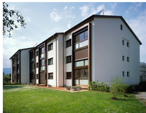
Imagen: Edificio de viviendas Rankweil-Schleipfweg después de la rehabilitación