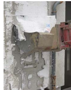
Fotos: Deconstrucción de un SATE