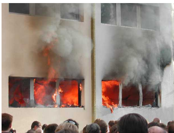
Imagen: Ensayo de fuego en fachada (después de 27 min.)