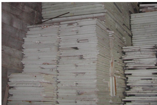
Foto: Planchas de EPS usadas