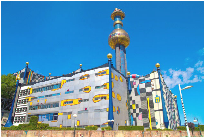
Foto: Planta de incineración de Spittelau

El valor calorífico del EPS se utiliza en las plantas de incineración y en las fábricas de cemento: 1 kg de residuos ahorra 1,3 litros de valioso gasóleo de calefacción. La ventaja de este proceso es que los requisitos relativos a la limpieza de los residuos de EPS son bajos.