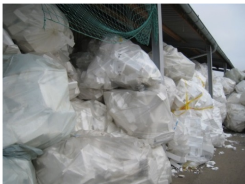
Foto: Bolsas de reciclaje de EPS