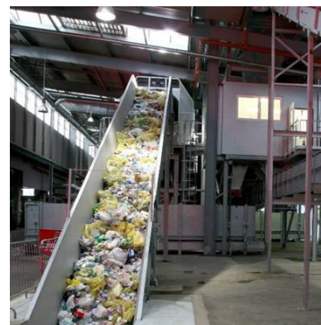
Foto: Planta de clasificación de residuos