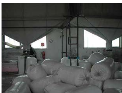
Fotos: Planta de reciclado