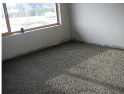
Foto: Relleno de EPS ligado